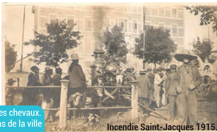
Incendie Saint-Jacques 1915.

On appelle « pompiers » les gens responsables du fonctionnement de la pompe à incendie.